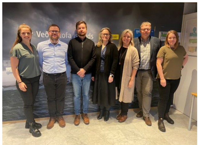
Fulltrúar í stjórn samráðsvettvangs um þekkingarsköpun vegna loftslagsbreytinga

Stofnun Sæmundar fróða á sæti í stjórn samráðsvettvangs um þekkingarsköpun vegna áhrifa loftslagsbreytinga. Samráðsvettvangurinn skal þjóna sem rými fyrir fundi, vinnustofur og fræðslu vegna rannsókna og greininga á áhrifum loftslagsbreytinga og starfar í umboði umhverfis-, orku- og loftslagsráðherra. Í stjórn vettvangsins sitja fulltrúar frá Samstarfsnefnd háskólastigsins, Stofnun Sæmundar fróða, Hafrannsóknastofnun, Náttúrufræðistofnun Íslands, Umhverfisstofnun, Embætti landlæknis og fulltrúi Veðurstofunnar sem sinnir formennsku.