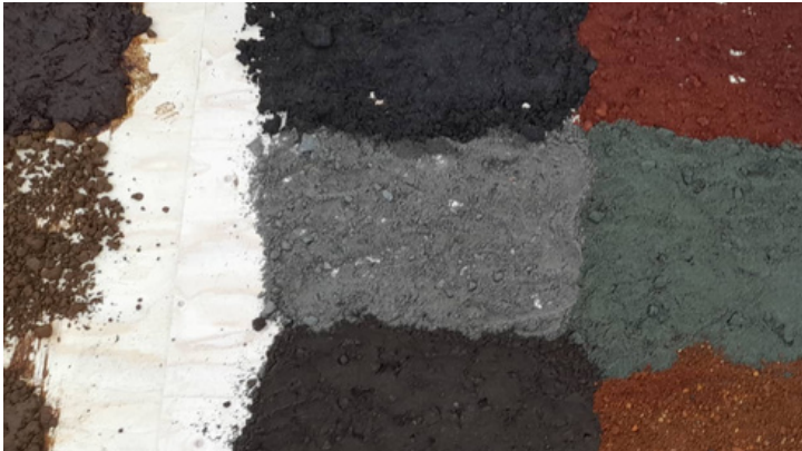
Jarðvegur á sýningunni

Í ágúst tók stofnunin þátt í fjölskynjunar innsetningu Theodore Teichmans í gróðurhúsi Norræna hússins í samstarfi við fjölmarga aðila og stofnanir. Í þessu listtengda rannsóknarverkefni fengu sýningargestir tækifæri að ganga í gegnum gagnvirka innsetningu og heyra í jarðvegi. Þátttakendum bauðst að labba berfættir yfir ólíkar jarðvegsgerðir, hlusta á hljóð af mismunandi áferð og skynja í rauntíma.